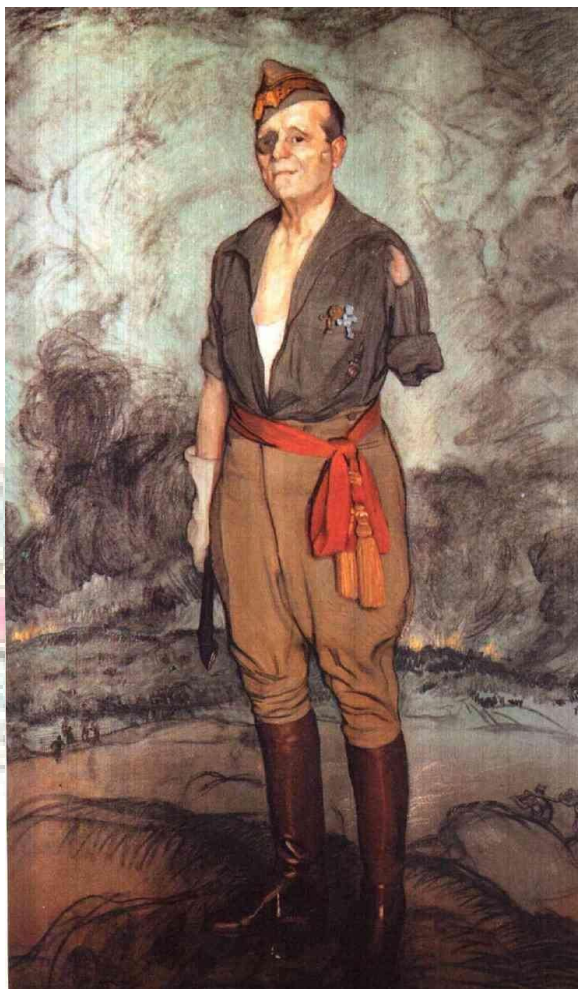
Teniente Coronel D. José Millán Astray y Terreros Fundador de La Legión